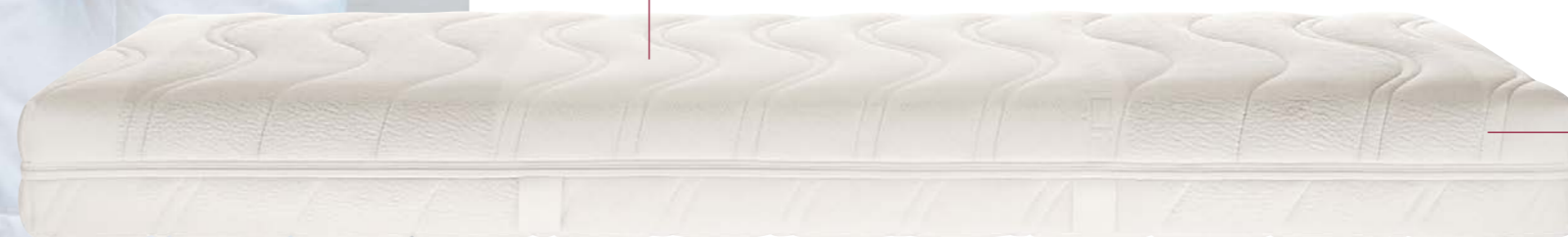
Jersey-Waschbezug* RW 814 Rundum-Bezug

Produkte, die der Gesundheit und dem Wohlfühlen dienen, müssen mit Verantwortung entwickelt, gefertigt, verpackt und transportiert werden. Alle Röwa Produkte sind in Deutschland hergestellt, von unabhängigen Instituten auf ihre Verträglichkeit bezüglich ergonomischer