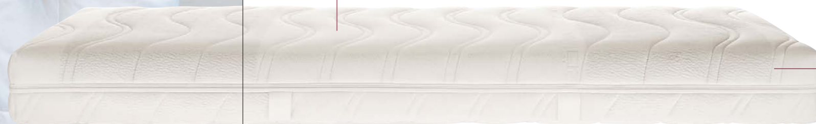
Jersey-Waschbezug* RW 814 Rundum-Bezug

Produkte, die der Gesundheit und dem Wohlfühlen dienen, müssen mit Verantwortung entwickelt, gefertigt, verpackt und transportiert werden. Alle Röwa Produkte sind in Deutschland hergestellt, von unabhängigen Instituten auf ihre Verträglichkeit bezüglich ergonomischer